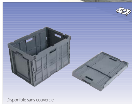
Disponible sans couvercle