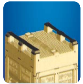
Mit zwei Kufen